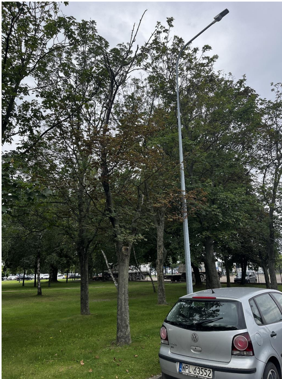
Fot. 4 Drzewo przeznaczone do wycinki – jawor