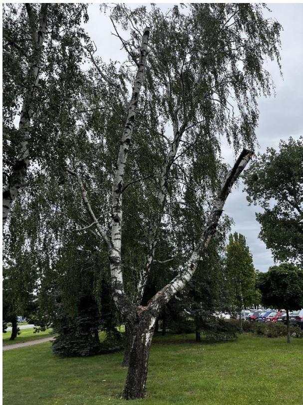
Fot. 3 Drzewo przeznaczone do wycinki – brzoza