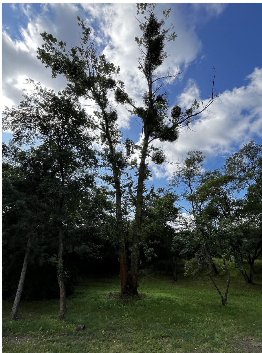
Fot. 1 Drzewo przeznaczone do wycinki – topola

Zestawione masy poszczególnych klas jakościowo-wymiarowych drewna zostały przemnożone przez ceny detaliczne drewna w właściwym miejscowo Nadleśnictwie Płock zgodnie z obowiązującym cennikiem detalicznym załączonym do niniejszego opracowania.