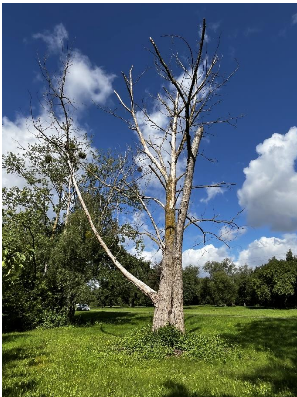
Fot. 2 Drzewo przeznaczone do wycinki – topola